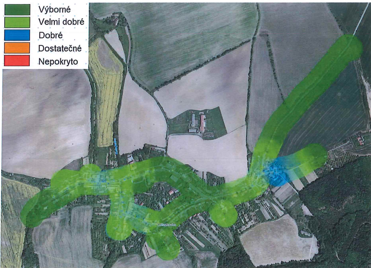
Obr. 3 Pokrytí obce Cetechovice signálem operátora Vodafone v síti GSM.