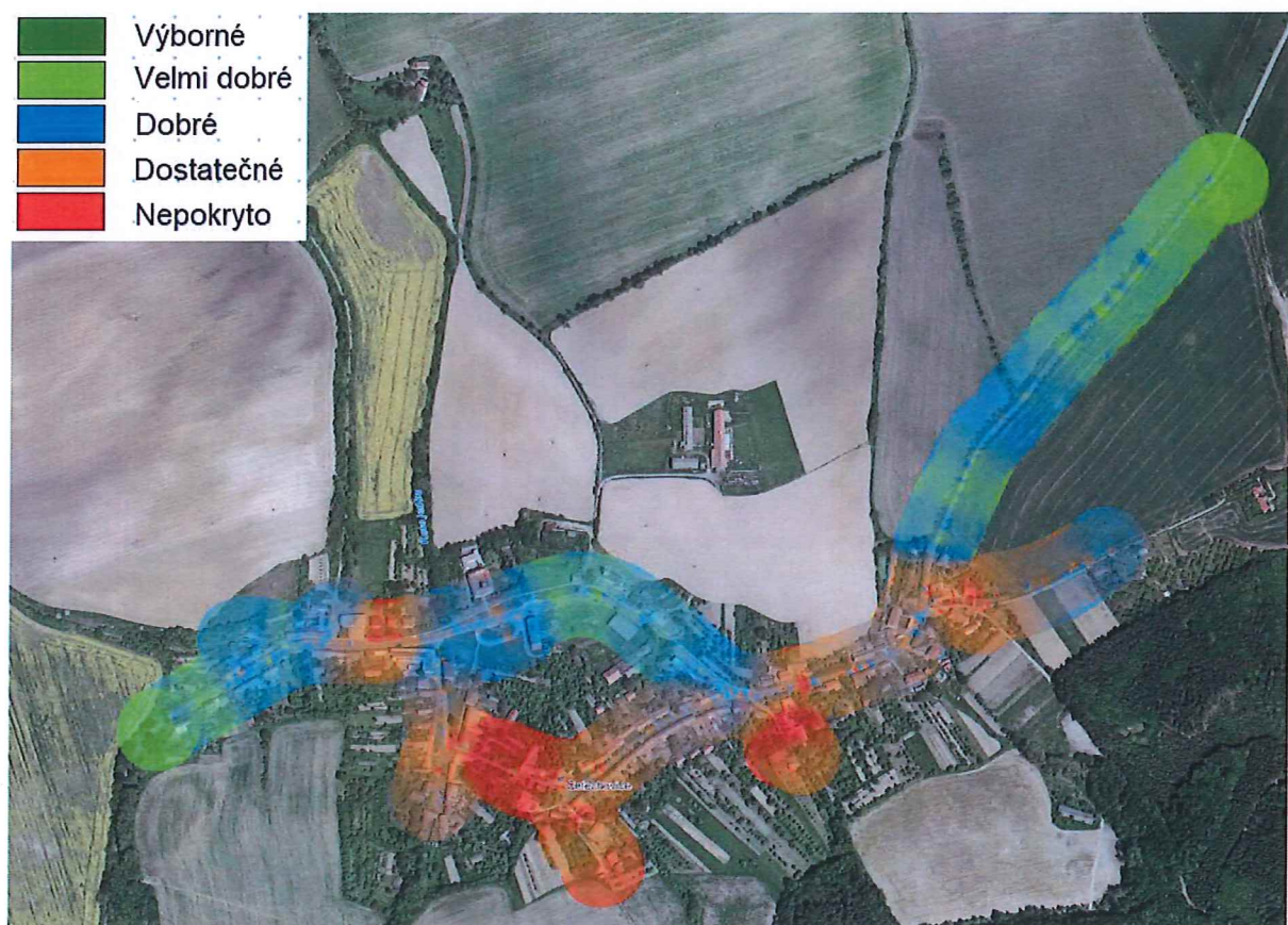
Obr. 4 Pokrytí obce Cetechovice signálem operátora T-Mobile v síti LTE.