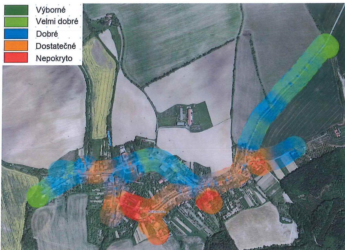
Obr. 5 Pokrytí obce Cetechovice signálem operátora O2 v síti LTE.