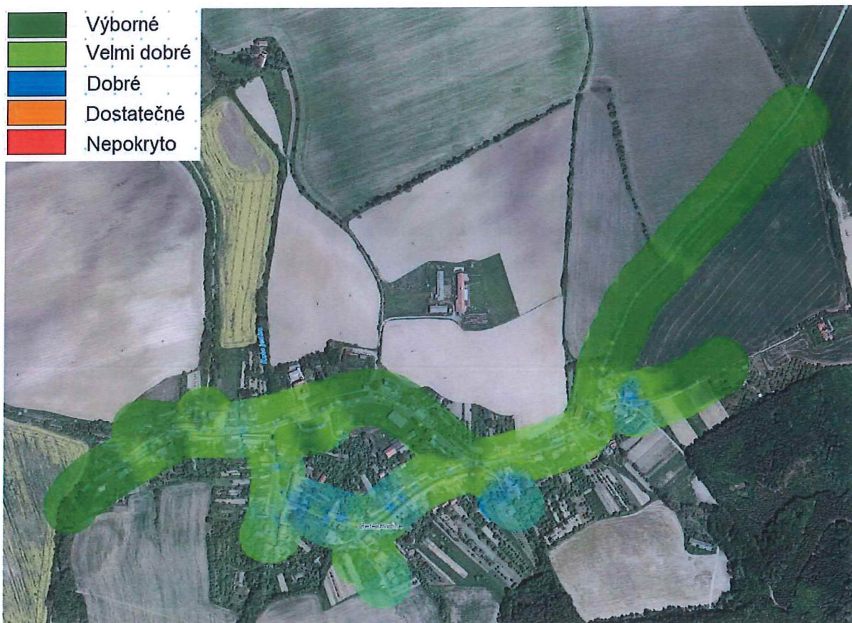
Obr. 1 Pokrytí obce Cetechovice signálem operátora T-Mobile v síti GSM.