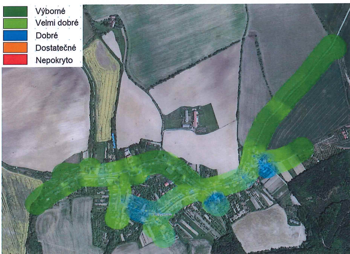
Obr. 2 Pokrytí obce Cetechovice signálem operátora O2 v síti GSM.